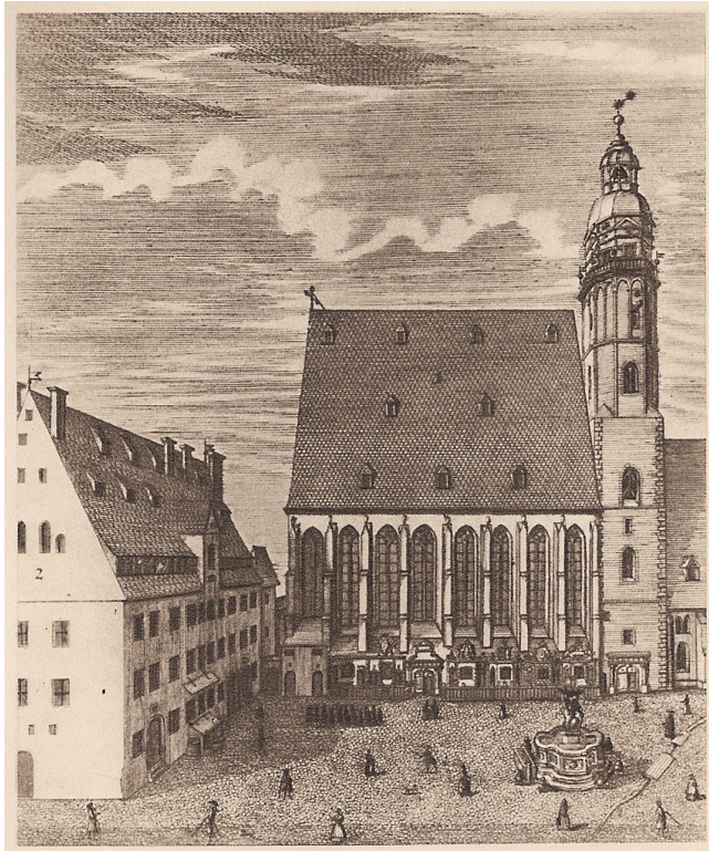
Johann Gottfried Krugner, Vista della Chiesa di San Tommaso a Lipsia (1723).

Bach nel corso della sua carriera ha sempre cercato di mettere radici, avendo come obiettivo la tranquillità economica e sociale. Questa tensione alla staticità viene placata nel 1723, anno in cui diventò Thomaskantor presso la chiesa di San Tommaso a Lipsia. La carica di Thomaskantor è storicamente di enorme importanza per la propagazione della musica all'interno della chiesa protestante, oltre ad aver rappresentato un lavoro prestigioso, ben pagato e ambito da svariati musicisti dell'epoca. A Lipsia Bach rimarrà fino alla sua morte ed è in questa città che scriverà pagine monumentali per la storia della musica. Innanzitutto il suo operato era incessante, avendo fra i vari incarichi quello specifico di scrivere una cantata a settimana; ma ciò non gli impedì di comporre la Messa in Si minore , il Magnificat , oltre alle varie Passioni ,