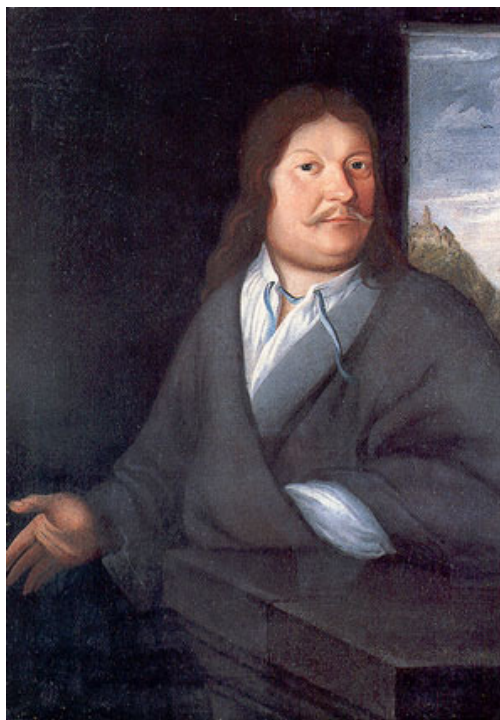
Johann David Herlicius (attr.), Johann Ambrosius Bach , 1685

al 1977, quando venne inciso il Voyager Golden Record, ossia un disco per grammofofono inserito nelle due sonde spaziali del programma Voyager destinate all'esplorazione del sistema solare esterno. Il disco venne destinato a qualunque forma di vita extraterrestre, con la finalità di descrivere e raccontare le diverse varietà di vita e cultura della Terra, e contiene parole registrate, saluti in varie lingue oltre a varie declinazioni della musica sul nostro pianeta. Sono presenti brani appartenenti alla cultura giavanese, georgiana, azera e così via ma è curioso notare che fra le varie canzoni (come Johnny B. Goode di Chuck Berry) e un paio di brani composti da Mozart e Beethoven, svetti in maniera preponderante il cognome Bach, forse perché inteso da una ristretta cerchia di umani come uno dei più fulgidi esempi della storia della musica. Sono infatti presenti ben tre brani da lui composti: la Gavotte