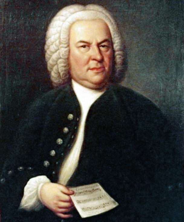
Elias Haussmann, Ritratto di Johann Sebastian Bach (1738)