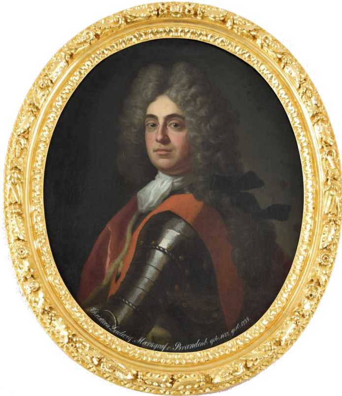
Friedrich Wilhelm Weidemann, Christian Ludwig di Brandenburg-Schwedt (1705).

giovannissimo a studiare musica grazie agli insegnamenti del padre, che fu molto devoto alla religione protestante, che ebbe due mogli e venti figli e che in vita sua, a differenza di compositori coevi come Händel, non viaggiò mai moltissimo, nonostante sia stato in grado di sintetizzare e amalgamare alla perfezione realtà musicali differenti e lontane geograficamente fra loro, dal contrappunto fiammingo allo stile concertante dei compositori italiani. Cercò per lungo tempo e con insistenza un luogo in cui mettere radici, animato da una forte voglia di stabilità. Iniziò come organista di corte e musicista da camera a Weimar, chiamato nel 1708 dal principe di Sassonia Johann Ernst, e già durante questo suo primo periodo ebbe modo di dedicarsi alla composizione dando al mondo un'opera come Il Clavicembalo ben temperato . Ma è nel 1717 che Bach assunse il ruolo di kappelmeister , ovvero di responsabile della musica in un determinato contesto non necessariamente ecclesiastico, presso la corte del principe Leopoldo a . Quest'ultimo era un uomo di cultura e grande